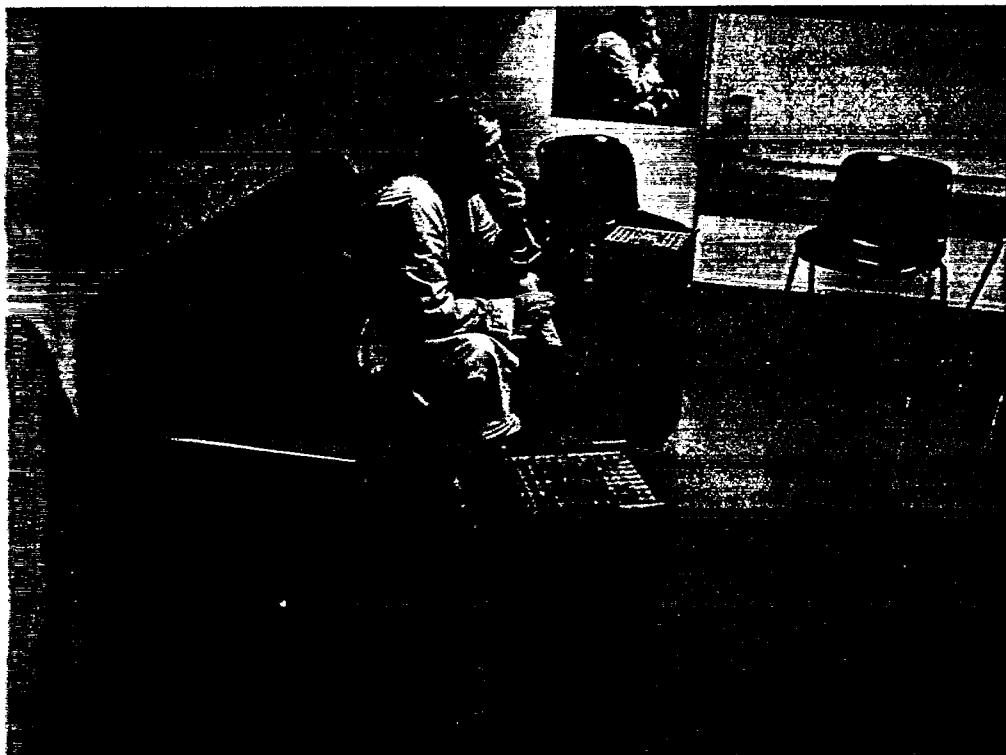
Tupakoitsijoiden ja ei-tupakoitsijoiden keskeisiä pelisääntöjä on yritetty selventää monin tavoin. Meilahden sairaalan tupakkahuone.

denkäyntiin. Kun asianaja harkitsee oikeudenkäyntiin ryhtymistä, hänen on tarkkaan punnittava mitkä ovat jutut menestymismahdollisuudet, eli jos juttu hävitään, kuka maksaakaan viulut.