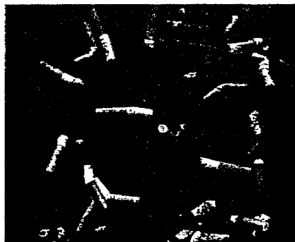
Meilahden sairaalan tuulikaapin tuhkakuppi.

Vaikka toistaiseksi ei ole uutisoitu, että