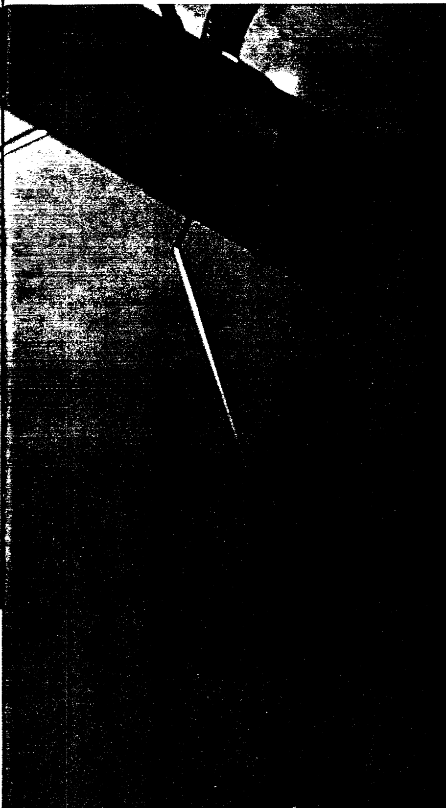
Kiireellistä tupakointia, rakennustyömaa Helsingin Ruoholahdessa.

E läkeläinen Pentti Aho , 66 kuolee kello 01.35 toukokuun 14 päivänä 1992 Pirkanmaan hoitokodissa Tampereella vaimon läsnäollessa. Taimi Aho ei koe tarpeelliseksi ruumiinavausta kuolemansyyn selvittämiseksi. Perus- ja välittömäksi kuolinsyyksi merkataan maligni keuhkokasvain, myötävaikuttavaksi tekijäksi krooninen bronkiitti-empfyseema.