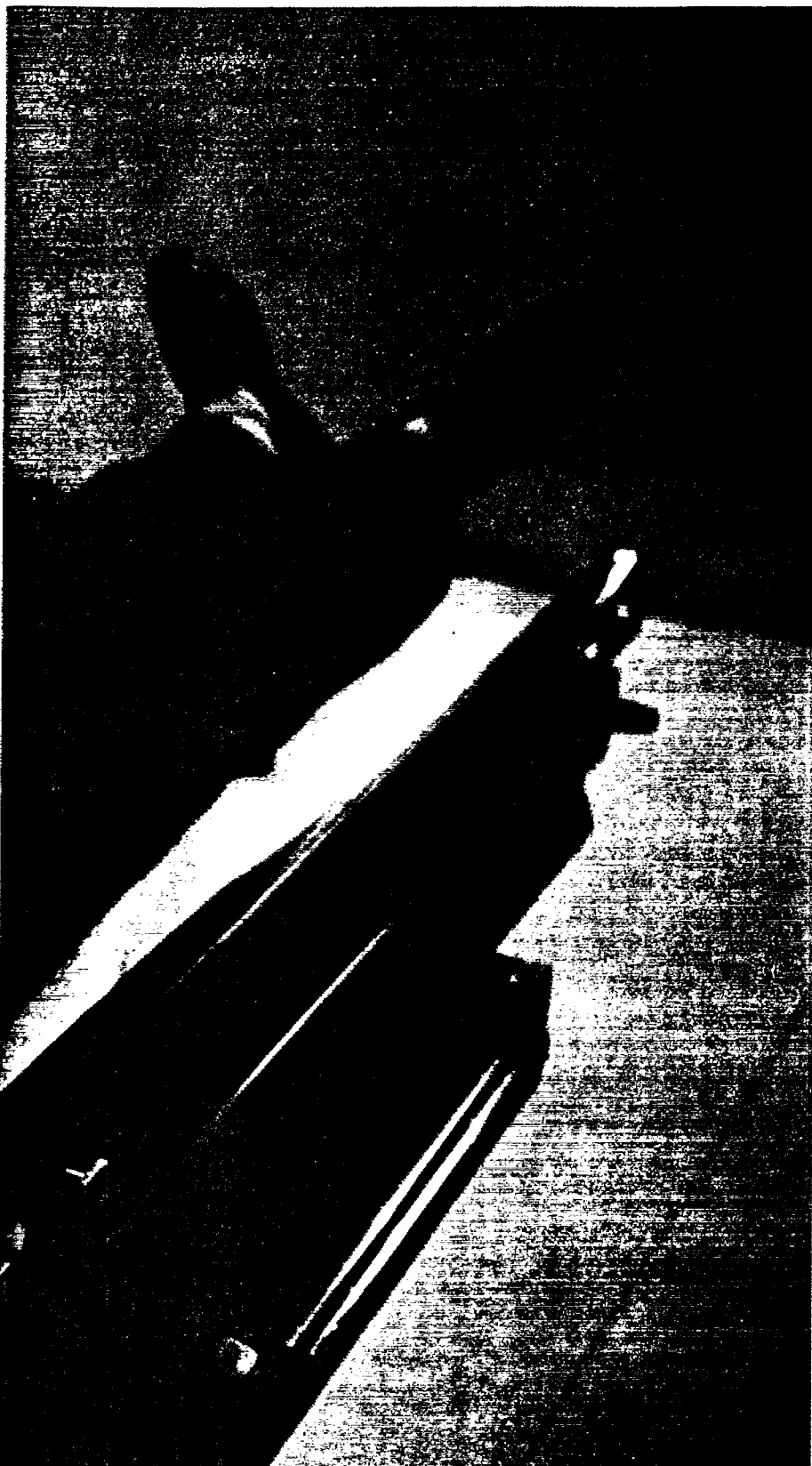
HYKS:in sädehoitoklinikka, 30 vuotta tupakkaa.

intressiä ajettavanaan, ei edes taloudellisia toisin kuin ehkä eräillä muilla. Oikeudenkäyntiä vaati syöpäsairaana Pentti Ahon etu ja oikeustaju».